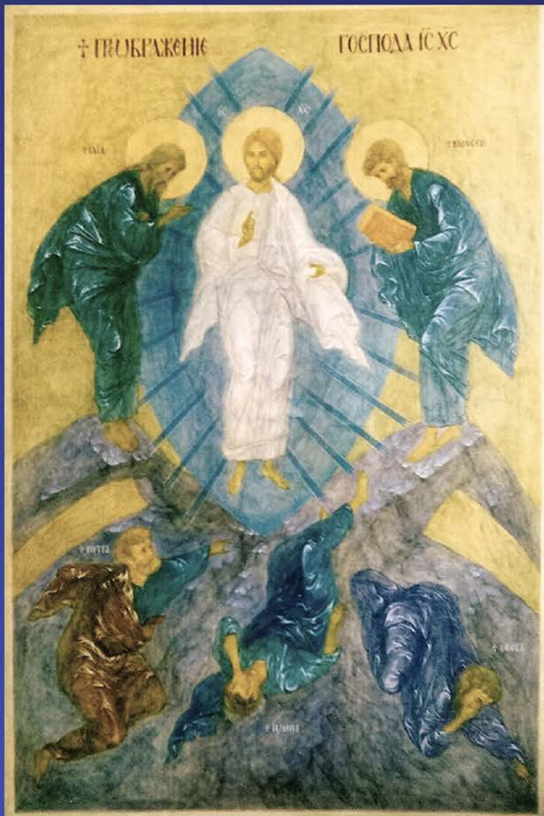
Преображення. 2000 р.