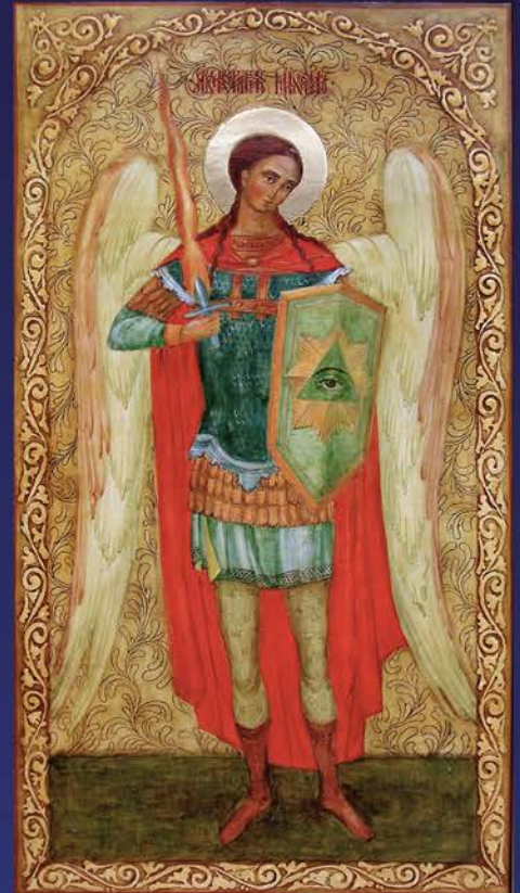
Архистратиг Михаїл. 2013 р.