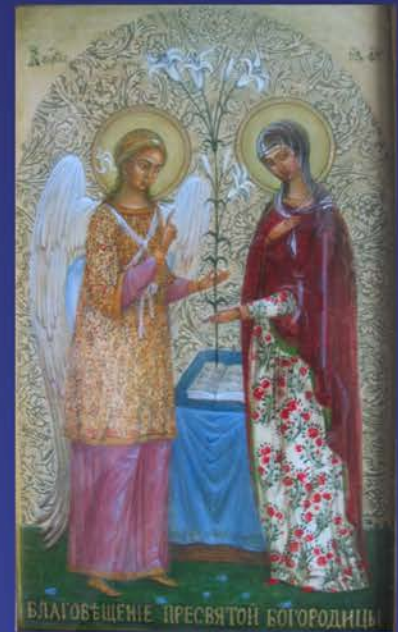
Благовіщення Пресвятої Богородиці. 2015 р.