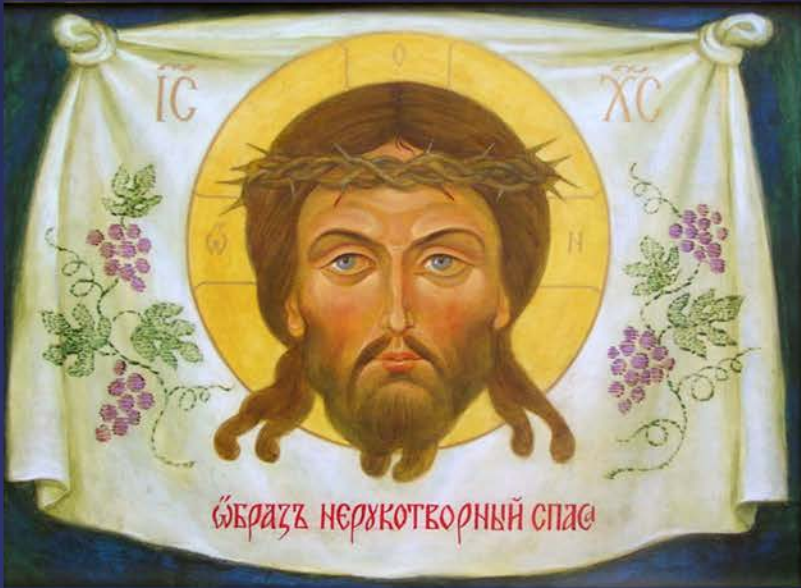
Нерукотворний образ Спасителя. 2015 р.