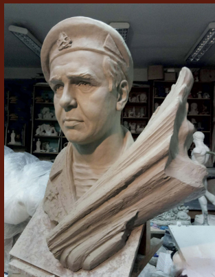
Герой України Міхнюк Олег. 2018