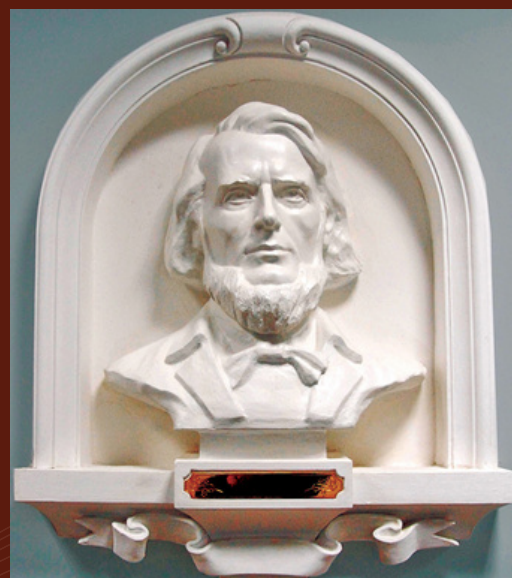
Погруддя К. Ушинського. 2008