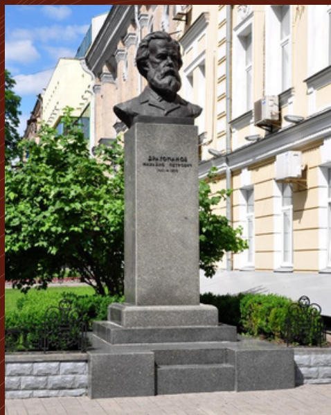
Пам'ятник Михайлу Драгоманову Центральний корпус НПУ імені М.П.Драгоманова, м. Київ . 2002