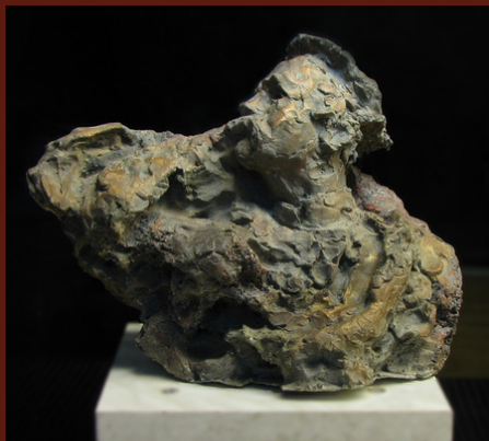
Тарас Шевченко на засланні, Південна Корея. 2019