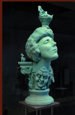
Номінем 1. 2016