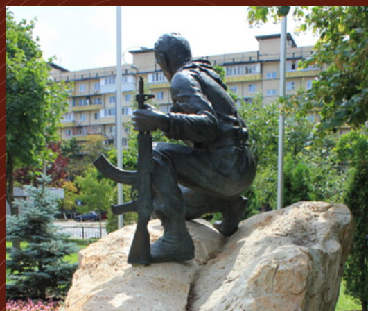
Пам'ятник воїнам-патріотам - тим, хто виконав обов'язок, зберігши честь і гідність м. Київ, вул.Архипенка7/5. 2014