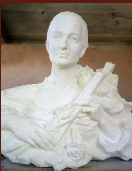
Пам'ятник Ревенко А.-К. 2017